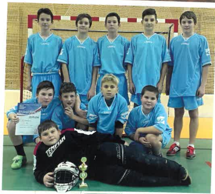
Florbalový tým - ZŠ Sobotka