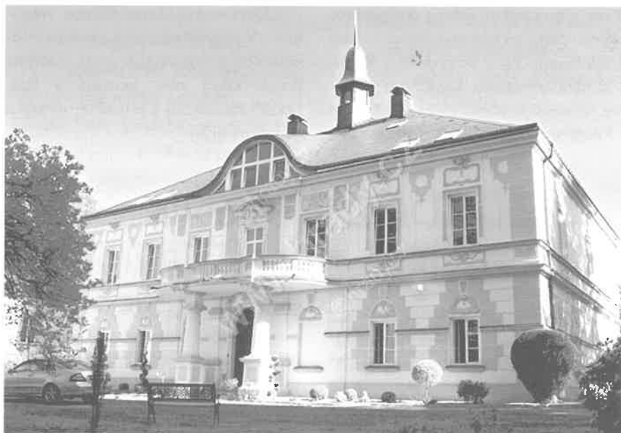
Zámek v Mladějově v Čechách.

Lesy si obhospodařujeme od začátku sami. Pole jsem zpočátku udržovala také sama pomocí sjednaných služeb. Dnes je to jednodušší, protože většina zemědělských pozemků je propachtovaná.