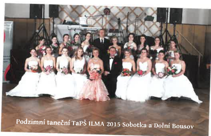
Podzimní taneční TaPŠ ILMA 2015 Sobotka a Dolní Bousov