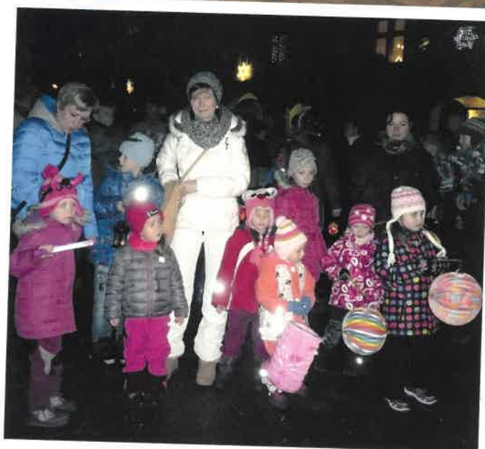
Česko zpívá koledy - lampionový průvod.