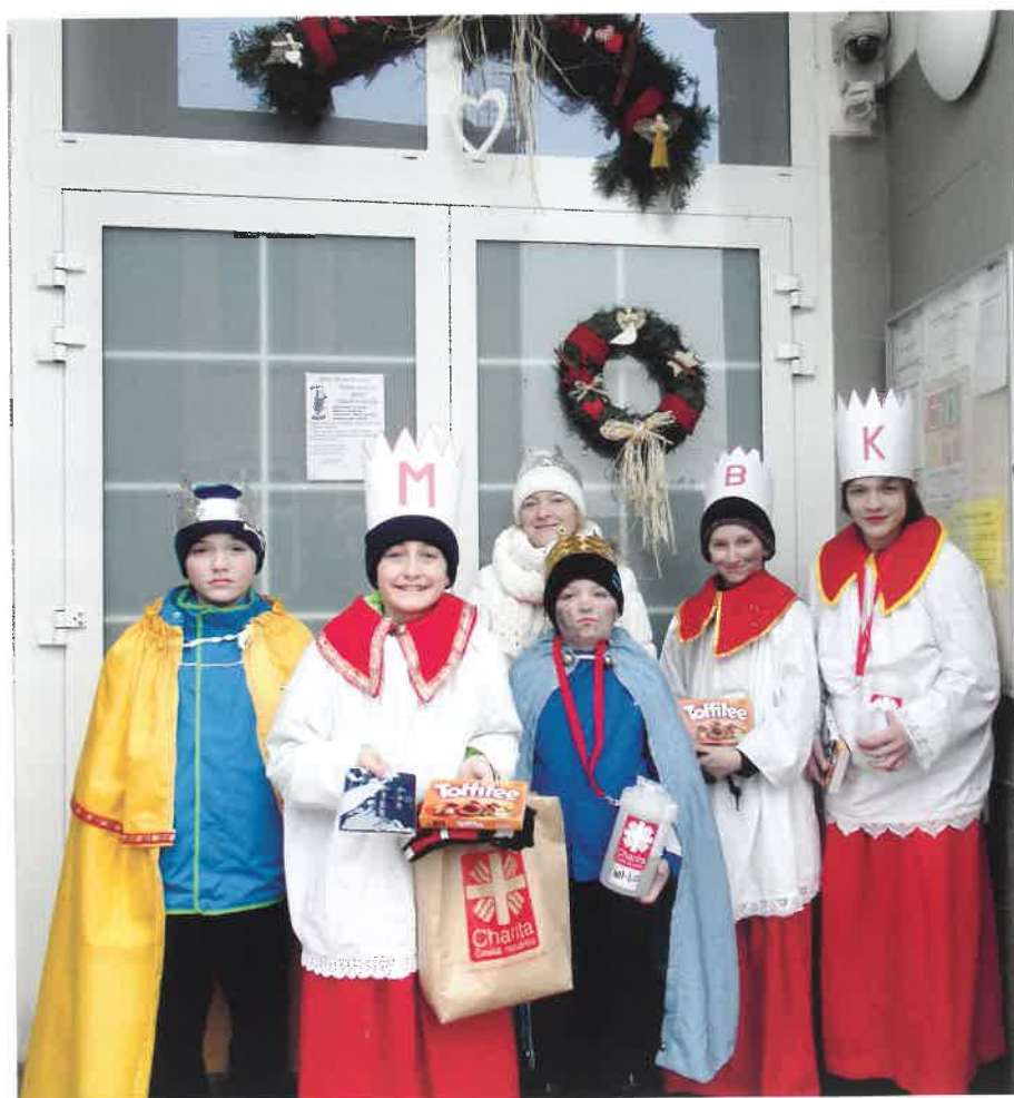
Třem králům z Dolního Bousova to při koledování moc slušelo.