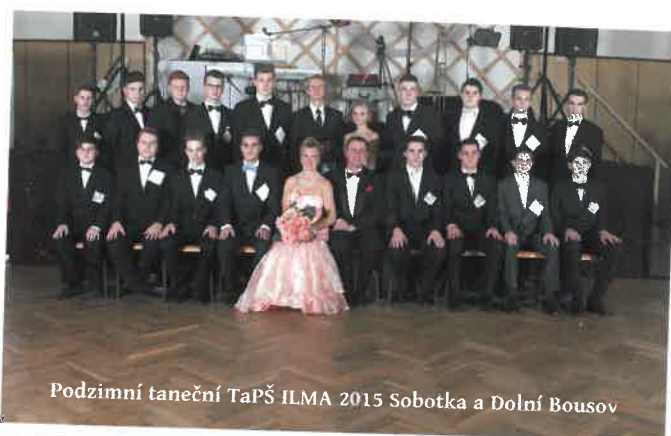
Podzimní taneční TaPŠ ILMA 2015 Sobotka a Dolní Bousov