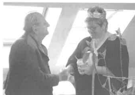
Tříkrálové sbírky se účastnili i uživatelé Domova pokojného stáří v Libošovicích.